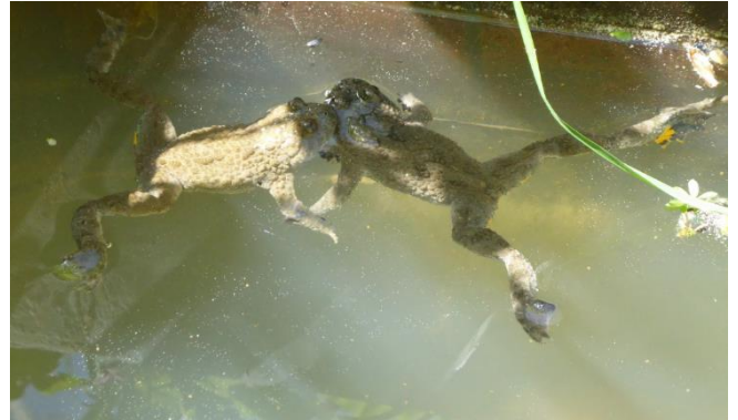
Gelbbauchunken am Schönberg