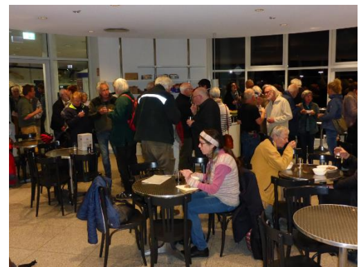
... gemütliche Stimmung bei Gesprächen und kleinen Häppchen

Nächste Vorstandssitzung: 19. Juni 2024 , 17 bis 19 Uhr, der Tagungsort ist aktuell noch offen Anregungen sind herzlich willkommen!