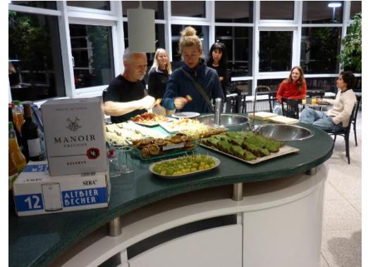
beim Aufbauen des Buffets: Herzlichen Dank an alle, die dazu beigetragen haben!